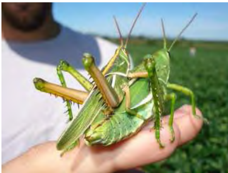
Foto N° 2 Tucuras de genero Elaeochlora , macho y hembra apareándose.

Colocan los huevos en espiga, bolsa o vaina. El resto de la cámara la llenan con secreción glutinosa, que es producto de las glándulas coeléticas, que protege al huevo de otros insectos o ácaros. El abdomen se estira por medio de las pleuras.