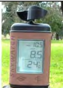
RECOMENDACIONES DE VELOCIDAD DEL VIENTO PARA PULVERIZACION AEREA ( Etiennot, A. – 2001 )