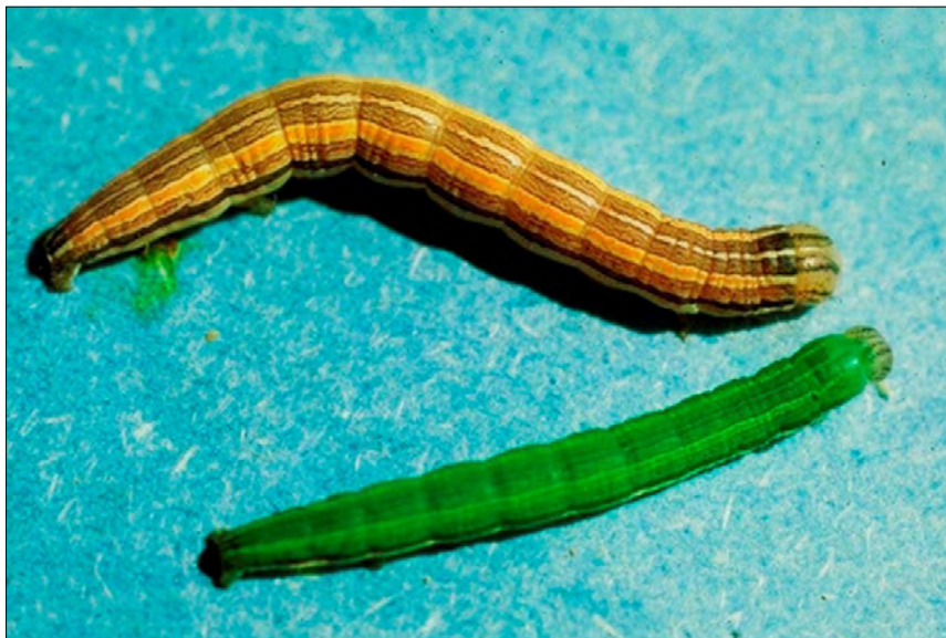
Figura 1.- Oruga desgranadora con dos de sus dos coloraciones.

En la parte dorsal y lateral del cuerpo puede presentar franjas longitudinales de color verde (Figura 1).