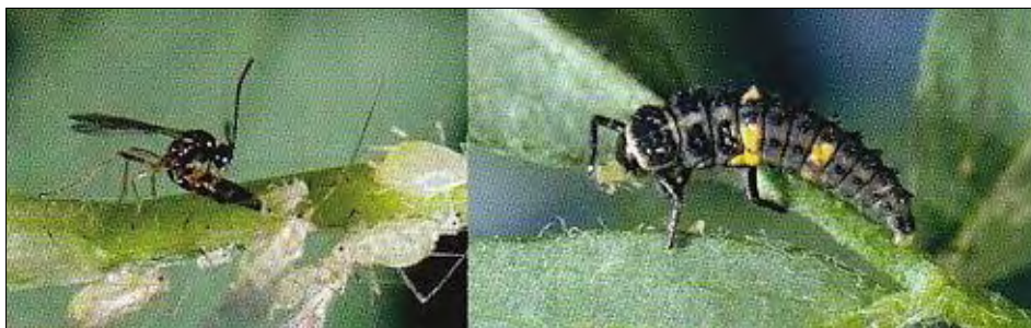
Foto 1: Insectos benéficos que colaboran con el control de plagas