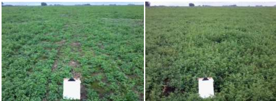
Figura 1. Tecnología de siembra simple SS (izquierda) vs tecnología de siembra doble SD (derecha).

La densidad de plantas se evaluó mediante el recuento mensual de pl/m 2 . El primer recuento se hizo después de la emergencia de las plántulas el 20 de Abril de 2014 y se extendió hasta el primer año de vida de la pastura en Mayo 2015.