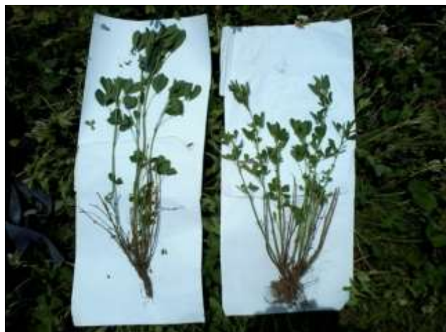
Figura 3. Diferencias morfológicas encontradas en plantas de un sistema de Siembra Simple (Izquierda) y Siembra Doble (derecha).

Según Park y Watkinson (2003), en éste contexto los cambios en la distancia de siembra podrían afectar las relaciones de competencia a nivel intra-específico y el tamaño individual de plantas, a su vez, esto podría influir en las características productivas de la pastura (Colabelli et al. , 2002).