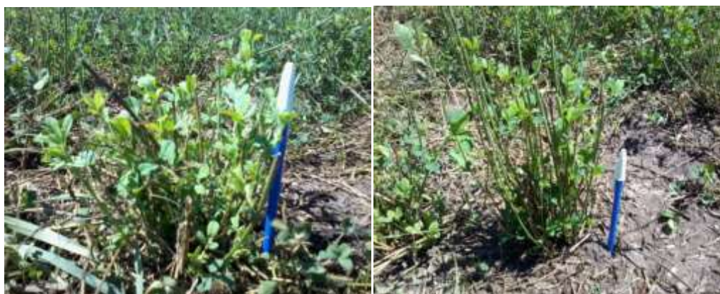
Figura 4. Remanente de plantas luego de pastoreo en sistema SD (izquierda) y despunte en sistema de SS (derecha).

Según Park y Watkinson (2003), en éste contexto los cambios en la distancia de siembra podrían afectar las relaciones de competencia a nivel intra-específico y el tamaño individual de plantas, a su vez, esto podría influir en las características productivas de la pastura (Colabelli et al. , 2002).