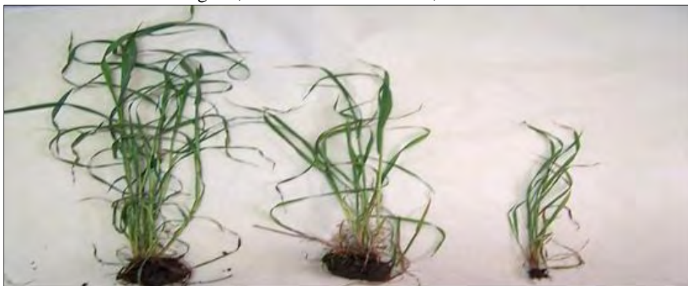
Figura 1: Plantas de avena negra con diferentes tratamientos de fertilización: Izquierda: Con Fosforo mas Nitrógeno; al medio: Con Fosforo; derecha: Sin fertilización.

En el cuadro 1, podemos ver lo conveniente de realizar una fertilización para lograr un resultado positivo en lo económico como productivo. Las ganancias de peso esperadas en este recurso en un periodo de 100 días es de 60 a 100 kilogramos (kg) por cabeza, este resultado estará en función de la carga (animales/ha y kg/ha) como así también del paquete de fertilización. A esto siempre debemos sumar MANEJO + SANIDAD + GENÉTICA. Además, podemos observar que en un año normal las mejores ganancias se logran con la máxima aplicación de fertilizantes, pero esto a su vez tiene otros beneficios como ser la cantidad de raciones generadas por tratamiento, para el caso del testigo solo podríamos criar 2 vaquillas de 200 kg durante 100 días (mas campo natural), mientras que con fertilización de fosforo y fosforo mas nitrógeno podríamos criar 6 y 8 vaquillas respectivamente durante el mismo periodo, por lo que la superficie necesaria para la recría será menor (menor costo de laboreo, personal y otros)