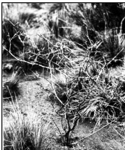
Aspecto otoñal del Mamuel Choique

Se ha comprobado que, en campos con muchos ejemplares de Mamuel Choique, los ovinos componen hasta el 8 % de su dieta con los brotes de esta leguminosa.