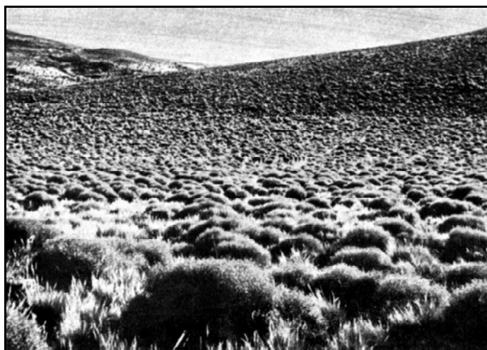
Arbustal de Neneo

Es uno de los arbustos más difundidos en la estepa patagónica, donde es muy fácil identificarlo por su característica forma de cojín, con alturas que, difícilmente, superan el metro.