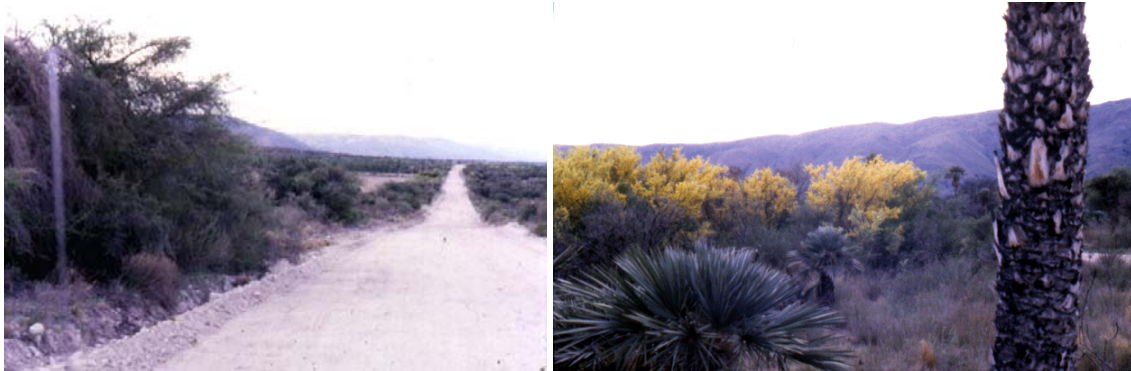
Ruta Prov.1 San Luis antes de asfaltarla, al sur de Papagayos, 1973: a)-Campos aún abiertos, sin alambrar. b)-Palmeras típicas de esa zona y espinillo en flor. Al fondo, sierra de Comechingones.