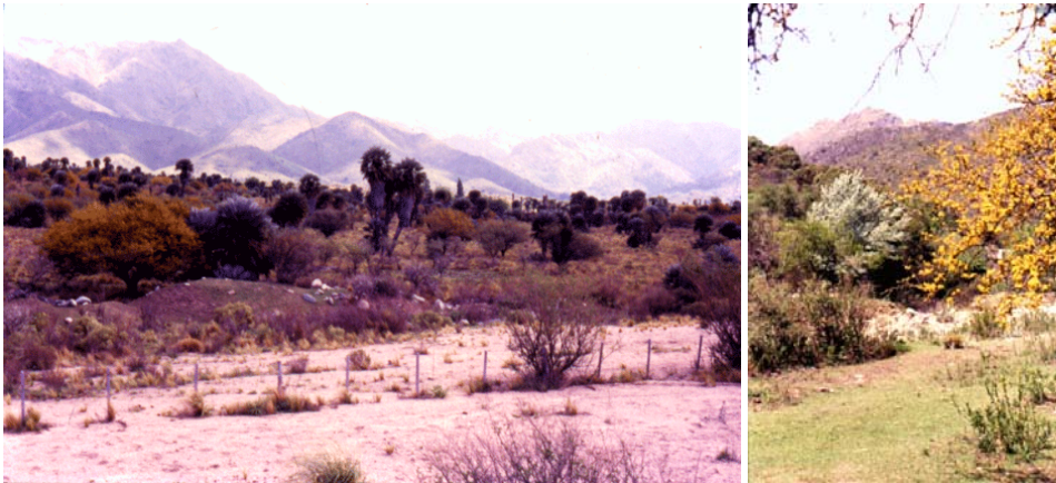
Zona del palmeral de Papagayos, San Luis, en septiembre; espinillo florecido; caranday (palmeras) vestidas.