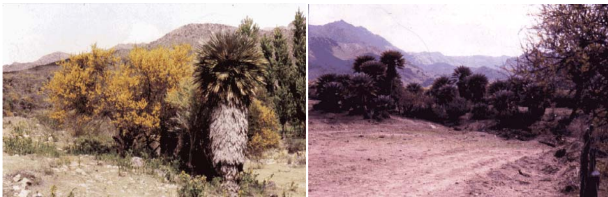
Espinillo en flor, palmera vestida; sierra. Zona del palmeral, Papagayos, San Luis. La palmera vestida (con hojas secas) es muy riesgosa en un incendio, pues sus hojas, muy livianas, son llevadas por el viento encendidas a gran distancia.