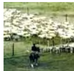
Arreo de ovinos