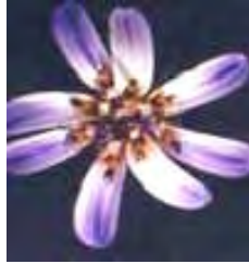
Margarita azul. Perezia recurvata