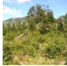
Bosque Andino Patagónico