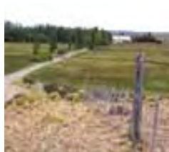
Campo Experimental Río Mayo