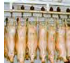
Producción de carne ovina.