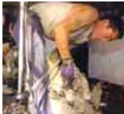
Esquila de ovinos