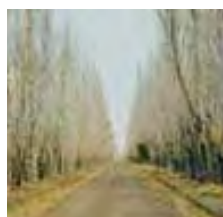
Cortina de álamo criollo