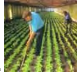
Agricultura bajo cubierta