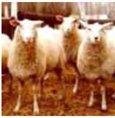
Borregas Frisona x Texel