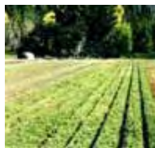
Campo Experimental Trevelín