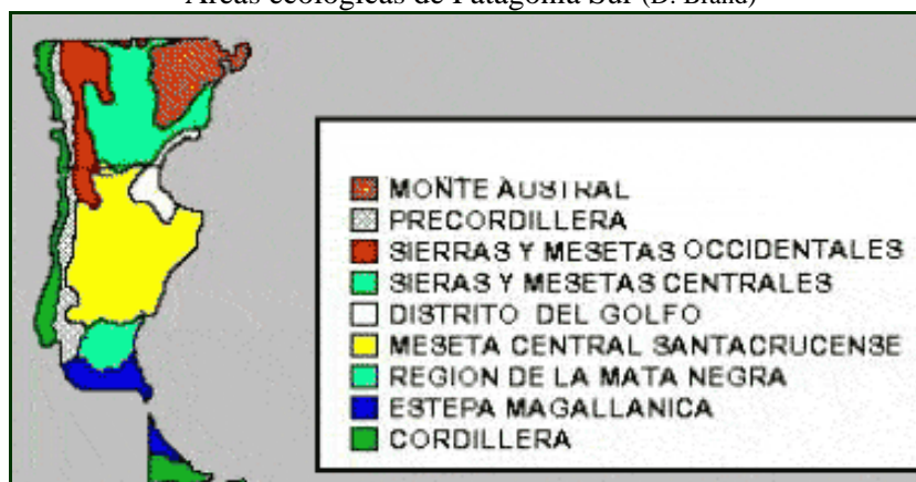
Áreas ecológicas de Patagonia Sur (D. Brand)