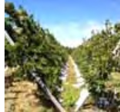
Plantación de cerezas en sistema de alta densidad