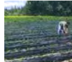
Producción de frutillas