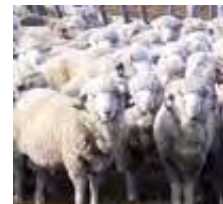
Carneros Merinos. Prueba de Progenie