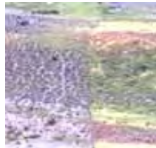
Campo con sobrepastoreo