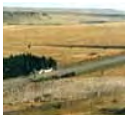
Arreo de ovinos