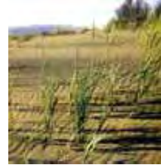
Fijación de médanos