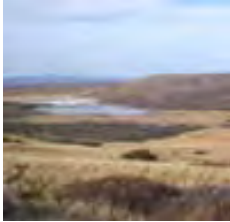
Paisaje típico de Sierras y Mesetas Occidentales