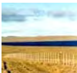
Campo Experimental Potrok Aike