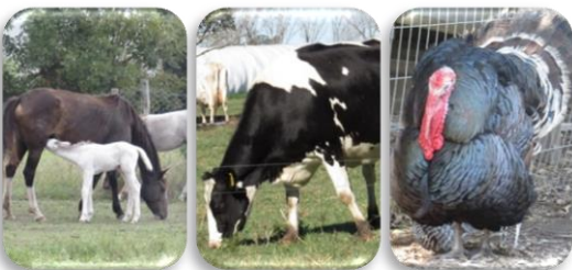
Las micotoxinas afectan la salud de animales domésticos y sus efectos dependen de la especie, la edad y el sexo del animal, entre otros factores.