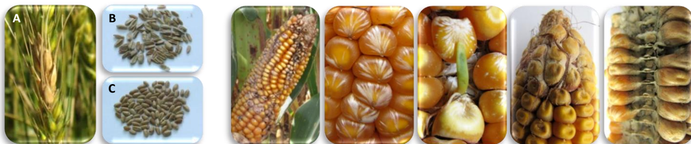
Espiga (A) y granos (B) de trigo afectados por Fusarium . Granos sanos (C).

Las micotoxinas son invisibles, inodoras, no tienen sabor o color que las pueda hacer detectables, pero el crecimiento del hongo puede ser observado por su coloración blanca, rosa o distintas tonalidades de verde, grisáceo o amarillento y por el «olor a húmedo» característico.