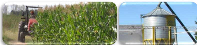
La contaminación con micotoxinas se produce a campo o en el almacenamiento si se dan las condiciones para el crecimiento de los hongos.

La contaminación se produce naturalmente a nivel de campo, almacenamiento o en las etapas de elaboración de alimentos cuando existen las condiciones ambientales para el desarrollo del hongo.