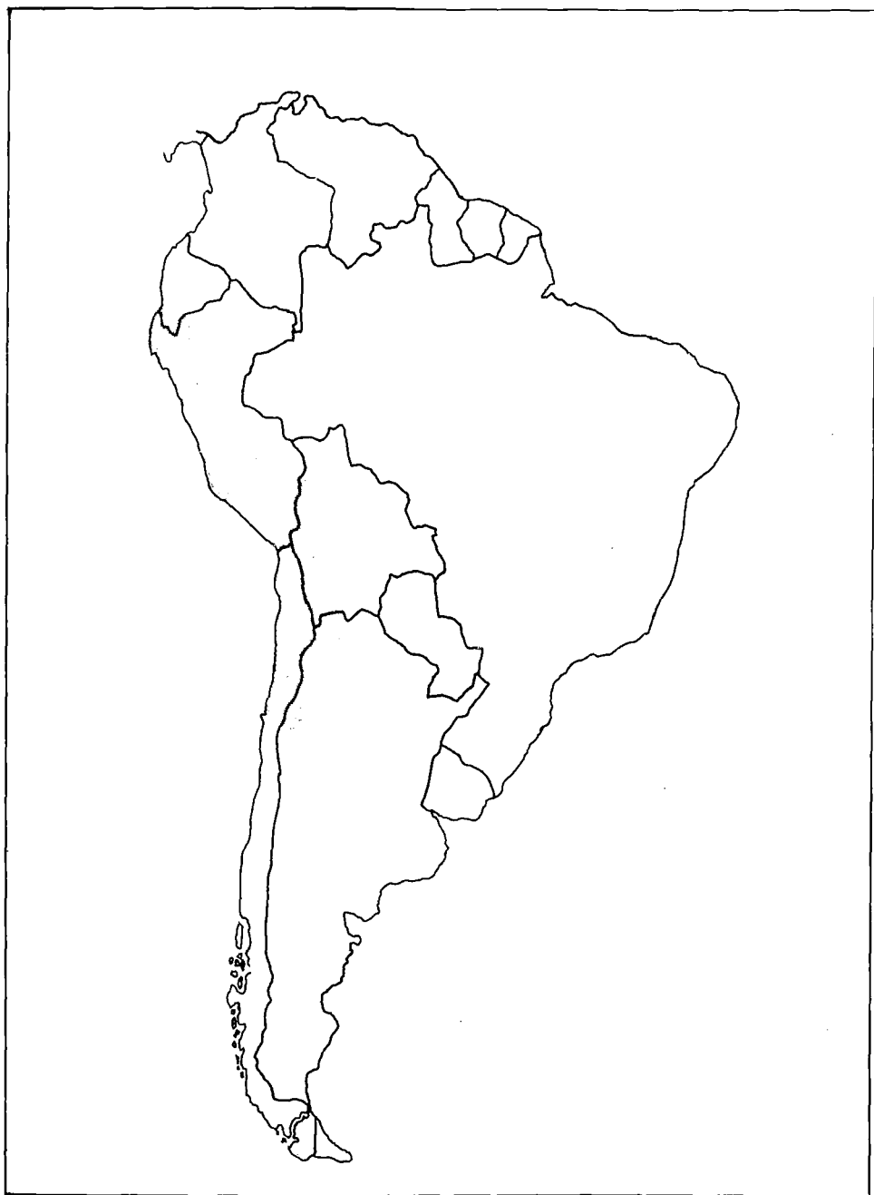
MAPA 3 Area de distribución de los camélidos sudamericanos