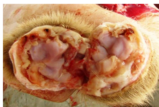
Figura 3. Lesión Macroscópica. Se observan lesiones proliferativas de la capsula articular que denota la cronicidad del cuadro.

Un resumen de los aspectos microscópicos de relevancia se presenta en las Tablas 3 y 4. Microscópicamente las lesiones articulares se caracterizaron por la infiltración linfoidea, acompañada de proliferación papilar de capsula sinovial y fibroplasia del tejido conectivo sub-capsular (animal 1). En algunos casos