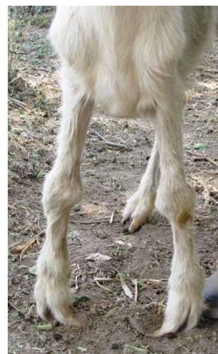
Figura 1. Artritis bilateral severa de los carpos en una cabrilla. Se observa deformación de ambos miembros.

En los casos que se logró realizar una necropsia, todos mostraron artritis que en sus inicios era de tipo serosa para después convertirse en proliferativa. En los más severos además se apreciaba necrosis caseosa (Figura 3). En animales de más larga evolución se observó erosión y adelgazamiento del cartílago articular que en algunos casos dejaba expuesto el hueso sub-condral (animal 2 y 5). En pulmón las lesiones fueron leves (animales 1, 4 y 5) y sólo en un animal se observaron lesiones macroscópicas (animal 4) caracterizadas por consolidación de los márgenes pulmonares. Los demás tejidos no presentaron lesiones macroscópicas de relevancia.