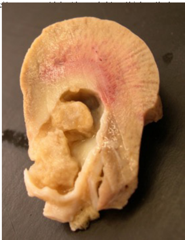
Figura 1: Novillo muerto en el corral, riñón. Pelvis renal distendida con dos cálculos de estruvita. Pérdida de diferenciación corteza-médula.

El hallazgo más relevante en las cuatro necropsias realizadas fue que ambos riñones presentaban coloración pálida con distribución difusa y pérdida de la diferencia-