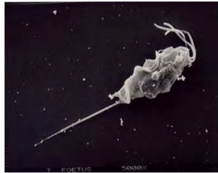
Fig. 2. Microfotografías de microscopía electrónica de Tetratrichomonas sp. obtenida del esmegma prepucial de toros. Obsérvense los 4 flagelos anteriores y la presencia de la membrana ondulante y axostilo posterior