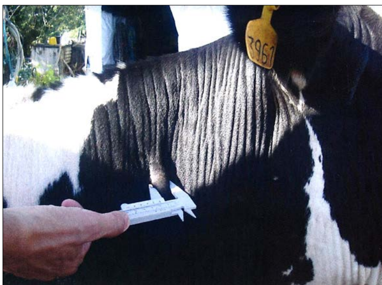
Reacción tuberculino positivo correspondiente a una prueba cervical simple realizada en la tabla de cuello, prueba que se utiliza exclusivamente para el saneamiento de los rodeos.

Una vez inscriptas las unidades productivas (UP), deberá realizarse una diagnóstico de situación del establecimiento con una prueba tuberculínica y, de acuerdo al resultado, iniciar las actividades de saneamiento con la implementación de por lo menos dos (2) pruebas tuberculínicas anuales, con un intervalo mínimo de 60 días y un máximo de 6 meses entre cada una de ellas. Para lograr la certificación oficial de libre de TB, dichas pruebas deben presentar resultados negativos.