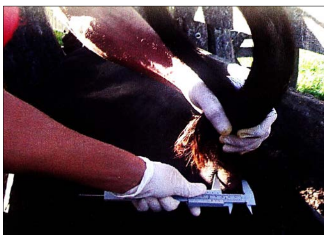
Reacción tuberculino positivo, correspondiente a la prueba ano caudal, prueba operativa de rutina que se utiliza en las tareas de saneamiento y certificación.

El Servicio Nacional de Sanidad y Calidad Agroalimentaria (Senasa), a través de su Resolución N° 128, del 16 de marzo del 2012, aprobó el Plan Nacional de Control y Erradicación de la Tuberculosis Bovina en la República Argentina. La norma, que entró en vigencia desde el 1° de junio de 2012, reemplaza a la Resolución Senasa N° 115/2009.