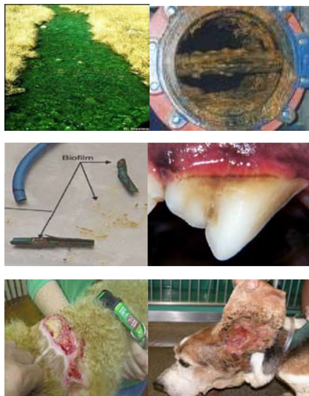
Figura 1. Ejemplos de biofilms. (A) en ríos; (B) en drenajes; (C) en catéteres; (D) en dientes; (E) en herida de piel; (F) en un caso de otitis externa.

La fase de adhesión se ha dividido posteriormente en una etapa reversible y una irreversible en reconocimiento a que la adhesión a la superficie inicialmente es débil. En esta etapa se produce la activación de mecanismos específicos que permiten la transición celular a una asociación con la superficie de muy alta estabilidad. La formación de agrupaciones celulares discretas se conoce como formación de microcolonias, lo que puede suceder ya sea por crecimiento clonal de las células adheridas o por translocación activa a través de la superficie. Las microcolonias crecen en tamaño y coalescen para formar las macrocolonias. La macrocolonia típica consiste de torres semejantes a hongos separadas por espacios llenos de líquido. Sin embargo, también son posibles estructuras alternativas como por ejemplo, estructuras planas. Las células, dentro de la