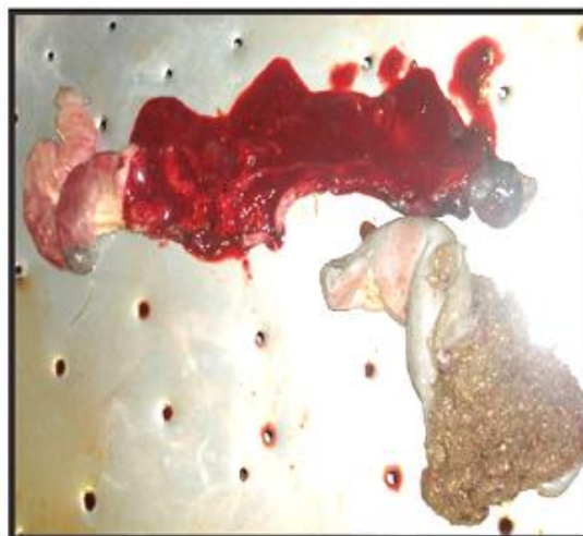
Figura 3. Contenido sanguinolento en la primera porción del duodeno.