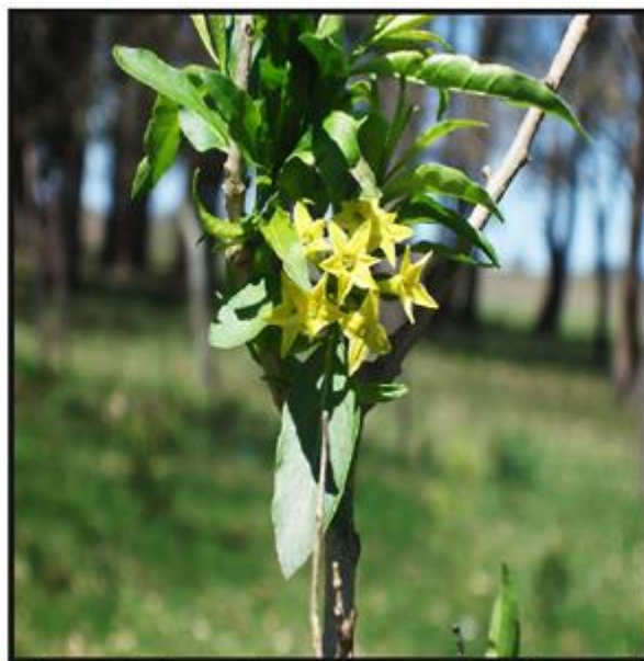
Figura 1. Planta de Cestrum parqui en flor.

Los animales fueron desparasitados al ingresar al lote y no recibieron ningún otro tratamiento. Se reportó que los animales afectados comenzaban a separarse del grupo, se retrasaban al ser trasladados, presentaban debilidad, salivación abundante, incoordinación, ataxia, posterior postración con decúbito lateral y finalmente muerte. Las muertes se producían dentro de las 48 hs de observados los primeros signos. Algunos animales afectados fueron tratados con antibióticos pero no se observó respuesta al tratamiento. En los animales afectados la letalidad fue del 100%.