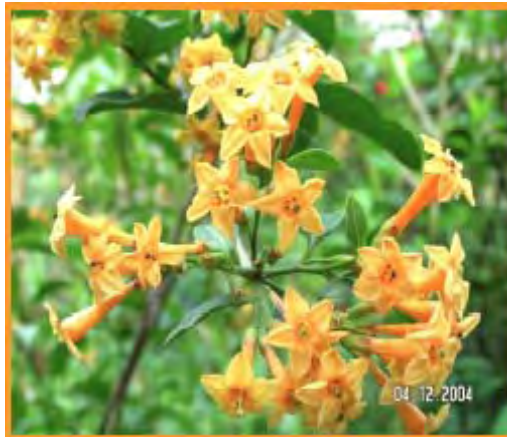
Figura 3.- Detalle de la flor del palque.

Las flores, de color amarillo, son tubulares: presentan una corola estrellada, con cinco lóbulos dispuestos sobre un tubo cilíndrico (Figura 3), y los frutos son ovoides, de color negro violáceo cuando maduros. Tiene reproducción sexual y también vegetativa, diseminándose principalmente por la acción de pájaros.