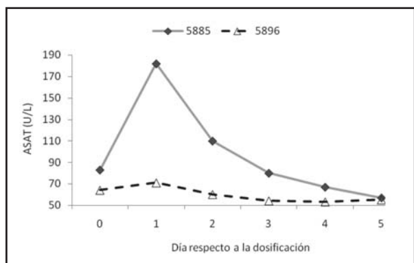
Figura 6. Concentración de la enzima aspartato amino transferasa (ASAT) durante el periodo experimental. Día 0= dosificación. Animal N° 5885 dosificado con 2 g de MS/kg de pv, de partes aéreas de planta de Wedelia glauca y animal N° 5896 control. Valores de referencia normales: (40-90 U/L).

La reproducción experimental de la enfermedad por la administración de W. glauca en bovinos demostró que el foco de campo fue causado por la ingestión de dicha planta, comportándose como tóxica a la dosis de 5 g de las partes aéreas de planta seca/kg de pv. Teniendo en cuenta el porcentaje de materia seca de la planta entera (26,4 % MS), correspondería a 19 g de partes aéreas de planta verde/kg de pv. Las dosis tóxicas determinadas experimentalmente por diferentes autores se encuentran entre 5 a 10 g/kg de pv de planta verde en ovinos y bovinos (Collazo y Riet-Correa, 1996), 4 a 10 g de hoja verde/kg de pv en bovinos (INTA, 2007) y 4 g de hoja verde/kg de pv en bovinos (Odriozola, 2003). Collazo y Riet-Correa (1996) no encontraron diferencias en las dosis necesarias para producir la enfermedad entre los meses de noviembre y marzo, indicando que no habría variación de toxicidad de la planta durante su ciclo vegetativo. Según Odriozola (Comunicación personal, 2010) tampoco habría cambios en la toxicidad según el ciclo vegetativo de la planta y las intoxicaciones en las diferentes épocas ocurrirían por una variación en la palatabilidad. Por el contrario Giusti (1934) menciona que la toxicidad de W. glauca varía con la época del año. De acuerdo a Odriozola (Comunicación personal, 2010), existiría una variación de toxicidad de acuerdo a las diferentes zonas geográficas de Argentina, ya que experimentos realizados por dicho in-