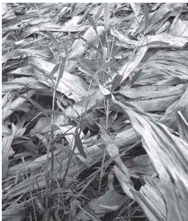
Figura 3. Presencia de plantas de Wedelia glauca en rastrojo de sorgo del potrero problema (junio, 2009).

Las principales alteraciones histopatológicas se observaron a nivel de hígado con necrosis centrolobulillar hemorrágica difusa. A nivel de zona intermedia y periportal, los núcleos presentaban picnosis,