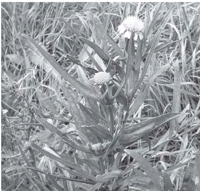
Figura 1. Wedelia glauca en estado de floración (verano).

gistro de un foco de intoxicación colectiva en suinos (Riet-Correa, 1978).