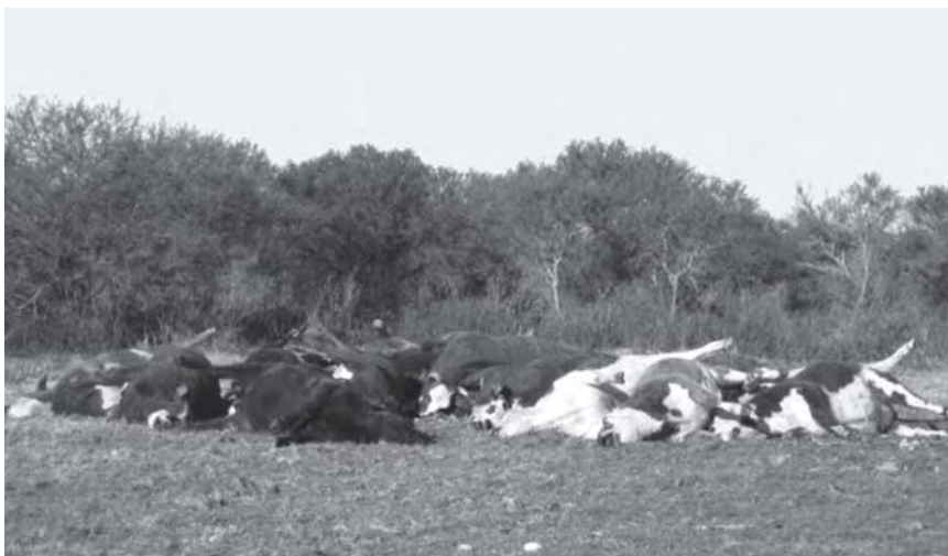
Figura 2. Animales muertos por consumo de Wedelia glauca en el foco.