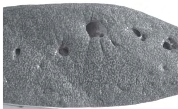
Figura 4. Hígado de un bovino muerto a causa de la intoxicación espontánea por Wedelia glauca . Acentuación del patrón acinar con áreas rojas (oscuras) intercaladas con áreas amarillas (claras).