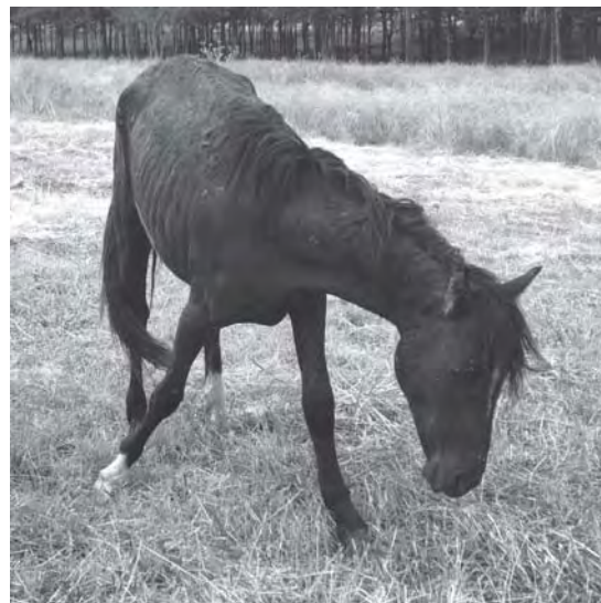
Figura 1. Equino hembra, 2 años de edad. Adelgazamiento, depresión, incoordinación.

En el mes de enero de 2010, en un predio ubicado en la 4ª seccional policial de Paysandú, se concurreó por un cuadro de mortalidad en equinos con sintomatolo-