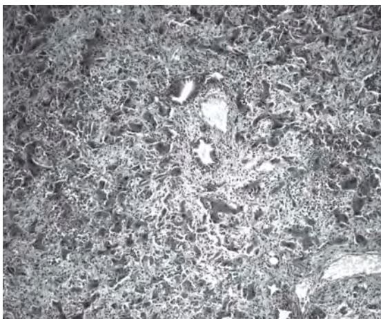
Figura 2. Hígado. Equino afectado en el primer foco. Fibroplasia, megalocitosis, proliferación de los canaliculos biliares, necrosis individual. H.E. 250X.

gía nerviosa. El lote de 45 animales permaneció durante el invierno del año 2009 en un potrero de campo natural de 30 ha con presencia de plantas de Senecio grisebachii y escaso forraje, donde el productor constató el consumo de la misma por los equinos. Los primeros signos clínicos en los animales afectados se observaron a partir de Noviembre de 2009. Presentaban pérdida de peso, ictericia, depresión, alejamiento del lote, andar en círculos e incoordinación y tenesmo. Fueron afectadas dos yeguas de 6 años, seis potrancas y una yegua de 15 años. La morbilidad fue de 20% y la mortalidad de 15,5%. En las necropsias practicadas se observó ictericia en subcutáneo, ascitis e hidropericardio. Hígado con parénquima con áreas rojizas y claras con aumento de consis-