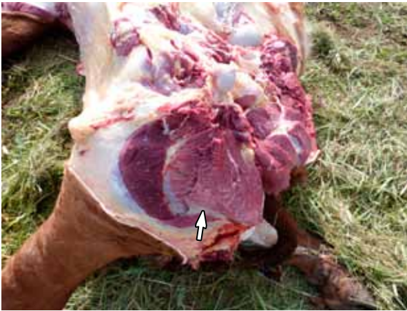
Figura 4. Amplias áreas de necrosis (flecha) en músculos aductor y semimembranoso.