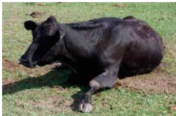
Figura 2. Vaca en período de estado, imposibilitada de superar el decúbito esternal.