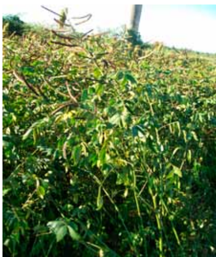
Figura 1. Sorgo contaminado con Cassia occidentalis , reconocible por sus vainas de color marrón con el extremo libre curvado hacia arriba.

La planta contiene principios miotóxicos que aún no fueron determinados. Posee altos niveles de alcaloides, albúmina tóxica, N-metilmorfina y oximetiltraquinonas 4, 9, 19, 20 . Estudios realizados en ratas revelaron que la toxicidad ocurre en intoxicaciones crónicas, no así en forma aguda o subaguda 18 . La medicina le asigna a esta planta propiedades antibacterianas, antimicóticas, anti-diabéticas, antiinflamatorias, anticancerígenas y anti-mutagénicas, así como actividad hepatoprotectora 21 . En Argentina se citan escasos episodios de intoxicación por consumo de cafetillo; los casos reportados ocurrieron en las provincias de Catamarca 1 y Salta 13 .