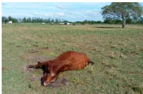
Figura 3. Vaca en decúbito lateral abandonado, cursando el episodio final de la intoxicación.

El objetivo del presente reporte fue comunicar el primer caso de intoxicación con C. occidentalis en la Provincia del Chaco y el segundo reconocido en la Provincia de Corrientes 6 , siendo el primero reportado para el Departamento de Goya.