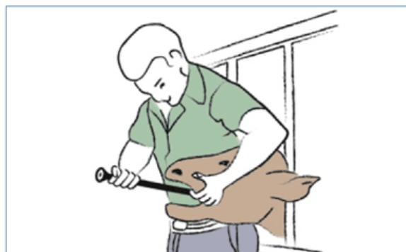
Figura 3: Empuje el aplicador hasta el fondo de la garganta del animal deslizándolo sobre la lengua.