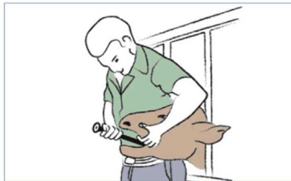
Figura 4: Cuando el animal traga, presione la varilla para liberar la cápsula.