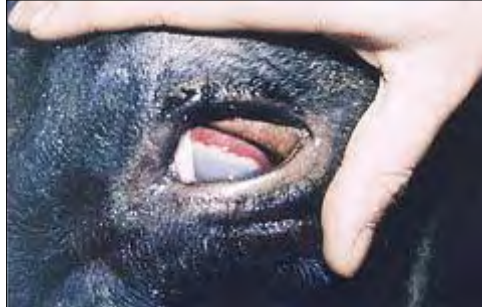
Severa inflamación en el borde superior del ojo, con proliferación neovascular.