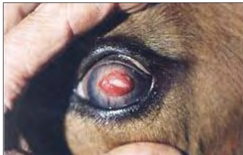
Queratoconjuntivitis avanzada con pannus central y vascularización superficial.