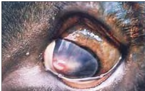
Cicatrización de úlcera central (Stöber/Scholz, 2008)