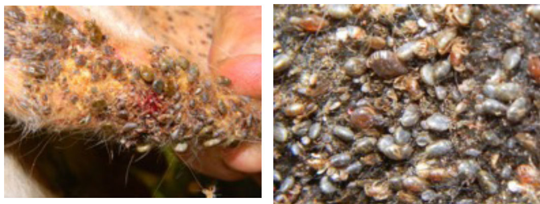
Figura 1. Vista parcial de zonas de piel parasitada con garrapata.