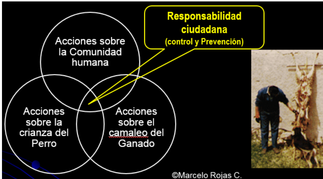
Fig 2. Competencia principal para el control de la Hidatidosis