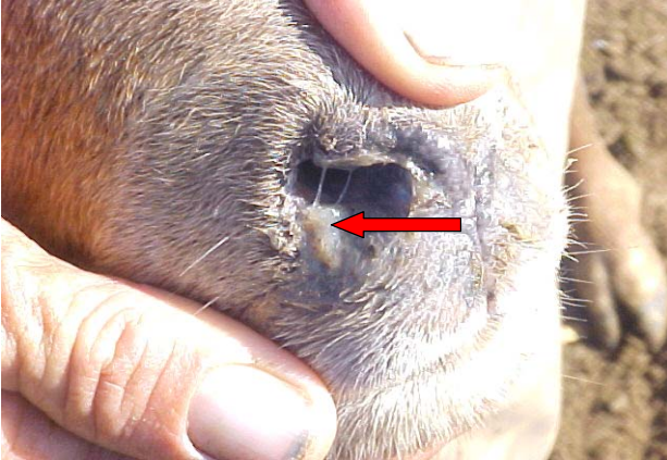
FIGURA 7. Oveja con secreción nasal de moco purulento típica de oestrosis./ Sheep with typical oestrosis nasal secretion.

enfermedades causadas por priones y una probable explicación de la persistencia de scrapie a pesar de los esfuerzos por controlarlo (39).