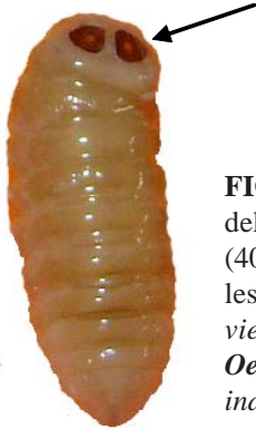
FIGURA 4. Vista ventral de una larva del tercer estadio (L3) de Oestrus ovis (40 X) (obsérvese los estigmas terminales señalados por la flecha)./ Ventral view of a third stage larvae (L3) of Oestrus ovis (note the terminal stigmas indicated by the arrow) (16).

El último segmento es bilobulado y muestra los estigmas (Fig. 4); cada lóbulo está coronado de 12 ganchos. En esta fase de la ontogénesis del insecto se notan los estigmas totalmente formados (16).