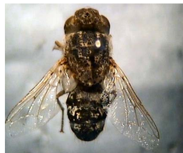
FIGURA 6. Adulto de Oestrus ovis ./ Oestrus ovis adult .

Al cabo de tres a seis semanas emergen los adultos (4). Durante este período la mosca hembra suele refugiarse en oquedades y grietas de edificaciones, y cuando tiene a su alcance ovejas o cabras deposita las larvas, como se explicó con antelación y así continúa el ciclo biológico (30). La mosca adulta (Fig. 6) se encuentra activa en los meses en los que la temperatura ambiental es alta (19, 31).