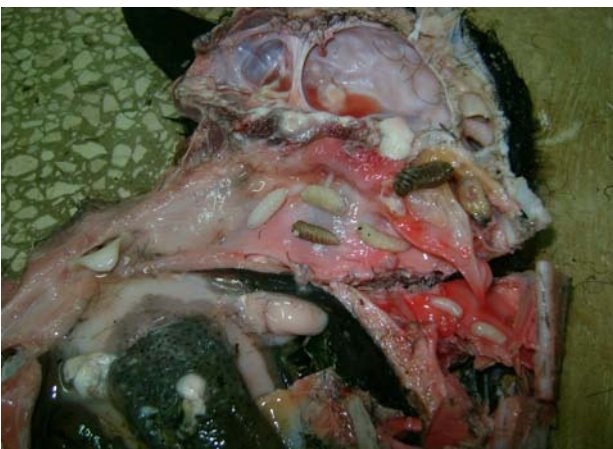
FIGURA 8. Larvas de Oestrus ovis fijadas en pasajes nasales./ Larvae of Oestrus ovis fixed in nasal passages.

La necropsia es un método confirmativo, aunque tiene limitaciones si no coincide con el sacrificio programado de los animales al concluir el ciclo de crianza. En la necropsia, se observan larvas de diferentes estadios del insecto parasitando los senos frontales (Fig. 8) donde migran hacia las cavidades sinusales, y se desarrollan desde el primer hasta el tercer estadio (11, 27).