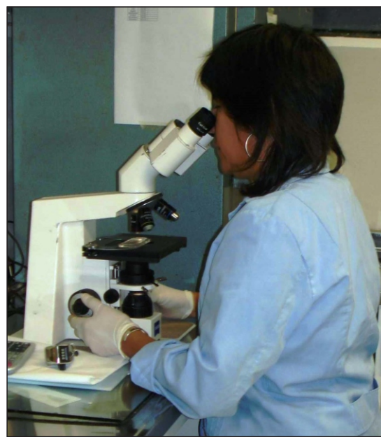
Foto 2. Conteo de huevos.

básicamente estima en una escala de 1 a 5 el grado de anemia que tiene el animal mirando los tejidos que rodean el globo ocular), peso corporal, hematocrito y todos los parámetros sanguíneos, al día 0, 28, 35 y 42 post inoculación. En la Tabla 1 se muestra el número de corderos machos y hembras usados en los años 2011 y 2012 en la EEA Mercedes, Corrientes.