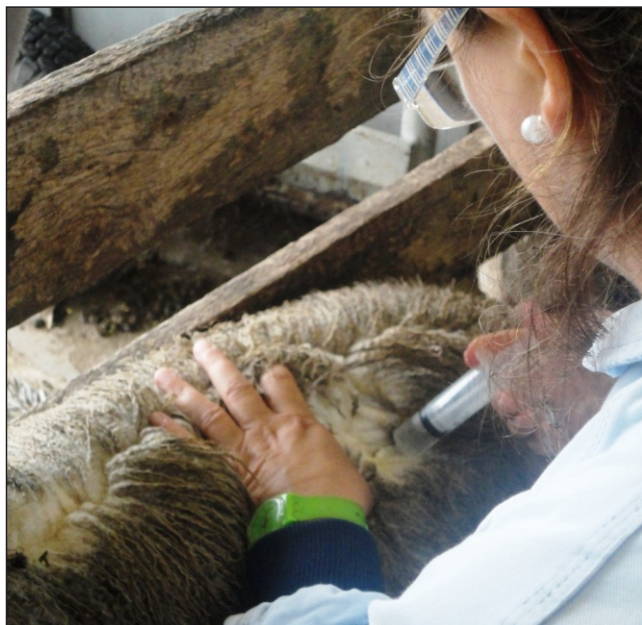
Foto 1. Inoculación de larvas 3.

segunda etapa y con el objeto de confirmar su resistencia o susceptibilidad a los parásitos, a los corderos hijos, a la edad de 5 meses, partiendo de un HPG cero, se les inoculaba 5000 larvas (L3) intraruminal, cultivadas en el laboratorio, a partir de huevos de parásitos del establecimiento (con un 84% de Haemonchus contortus ), y se midió el HPG, FAMCHA® (El término FAMACHA es un acrónimo que se corresponde con el nombre del autor y