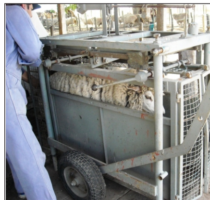
Foto 4. Peso de animales

“0”) y luego puestos en un corral para evitar diferencias en la ingesta de larvas de la pastura. En general, se observan pequeñas diferencias entre los hijos los Resistentes y de los Susceptibles al comienzo del ensayo y se acentúan entre el día 35 y 42. Si bien existen algunas diferencias entre los hijos de los Resistentes, siempre estas fueron muy superiores y significativas con los hijos de los Susceptibles.