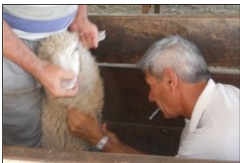
Foto 3. Sangrado de animales

En general en los ensayos que se han realizado, los animales resistentes presentan 33% menos de HPG que los susceptibles. En los gráficos 1 y 2 se muestra la evolución de la carga parasitaria en los ensayos de los años 2011 y 2012 de los corderos hijos de carneros y ovejas Susceptibles (línea azul) y los Resistentes (líneas rojas y verdes). Todos los corderos fueron desparasitados el mismo día (día cero