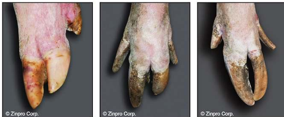
Figura 1. Ejemplos de uñas largas, uno de los problemas de pezuña más visibles en las cerdas reproductoras: leve (una o más uñas ligeramente más largas de lo normal, izquierda), moderado (una o más uñas significativamente más largas de lo normal, centro) y grave (uñas largas que afectan la marcha al caminar, derecha). (Fotos: Zinpro Corporation).

En su papel como directora de investigación de la producción, las principales responsabilidades de DeDecker incluyen tratar de cuantificar si un concepto, tecnología o idea potencial tiene valor económico y justifica que la empresa invierta recursos de investigación. “Necesitamos información objetiva para tomar decisiones empresariales, esté la decisión relacionada con la sanidad animal, la calidad de la carne, la fabricación de alimentos, la nutrición o la genética”, explica DeDecker. “El objetivo final es tomar mejores decisiones empresariales, lo que, para nosotros, se reduce a la economía”.