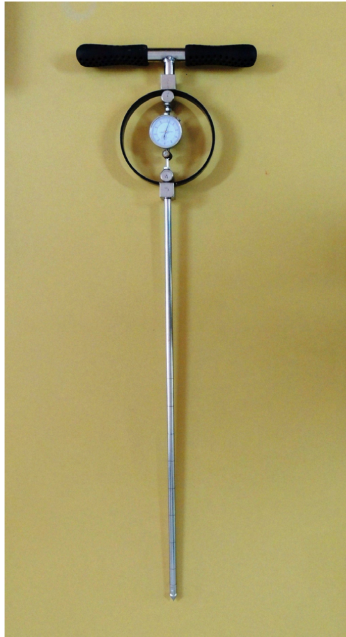
Figura 1. Penetrómetro de cono de acción vertical.

la norma ASAE. S 313, se fija en 30,5 \text{ mm}\cdot\text{s}^{-1} . El promedio de las medidas de la RP, dentro de un rango prefijado de profundidades, recibe el nombre de índice de cono. Se expresa en unidades de presión que surgen de dividir el esfuerzo para introducir el cono en el suelo por la superficie de la base del cono usado. La fuerza es marcada por un reloj que lleva el instrumento, mientras que para la superficie se toma el área de proyección del cono. Los valores obtenidos deben ser transformados en MegaPascuales (MPa) y ajustados a una determinada humedad, pues es éste el factor que más influye sobre la RP.