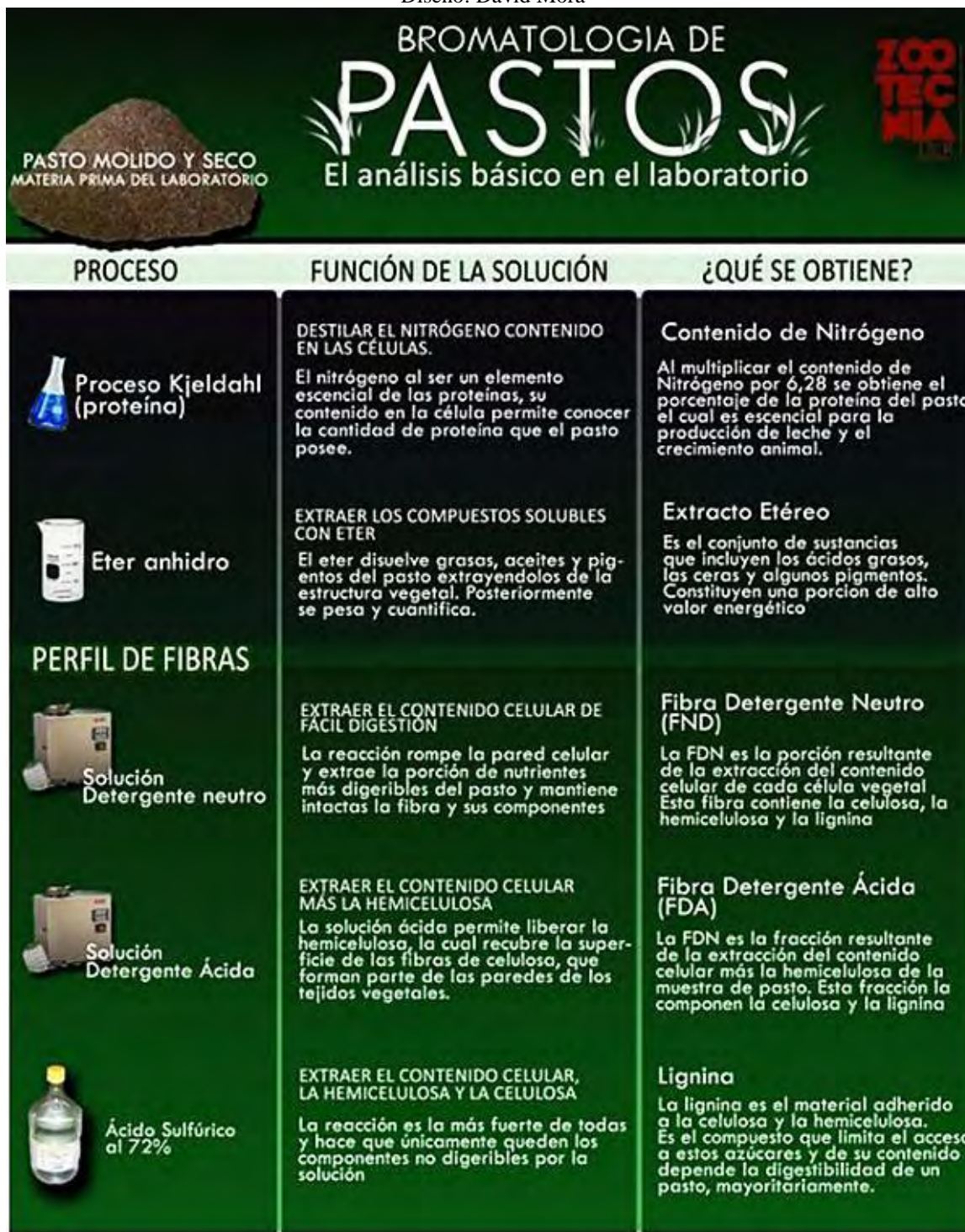
Figura 3.- Resumen de los procesos básicos que se efectúan a las muestras de pasto molido en el laboratorio. Diseño: David Mora