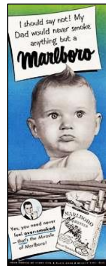
Quando el cigarrillo era recomendado por los médicos.

En la primera mitad del siglo ya circulaban algunos estudios sobre los efectos nocivos del cigarrillo, pero su existencia era desconocida por el público en general. Por el contrario, fumar era sinónimo de estatus, de elegancia y hasta recomendable para la salud. Consecuentemente, su consumo estaba socialmente aceptado y hasta se los consumía en los centros sanitarios. Varias imágenes de la época confirman ese hábito que hoy parece inverosímil: dos enfermeras que le ofrecían cigarrillos a un paciente internado; un aviso de 1947, en el que aparece un veterano de guerra convaleciente al que recompensan con un cartón de Chesterfield; o a Eugene O'Neill, Premio Nobel de Literatura, con un cigarrillo en la mano, mientras se reponía de una operación de apendicitis en 1937. En ese contexto, las empresas tabacaleras desplegaban toda su artillería publicitaria.