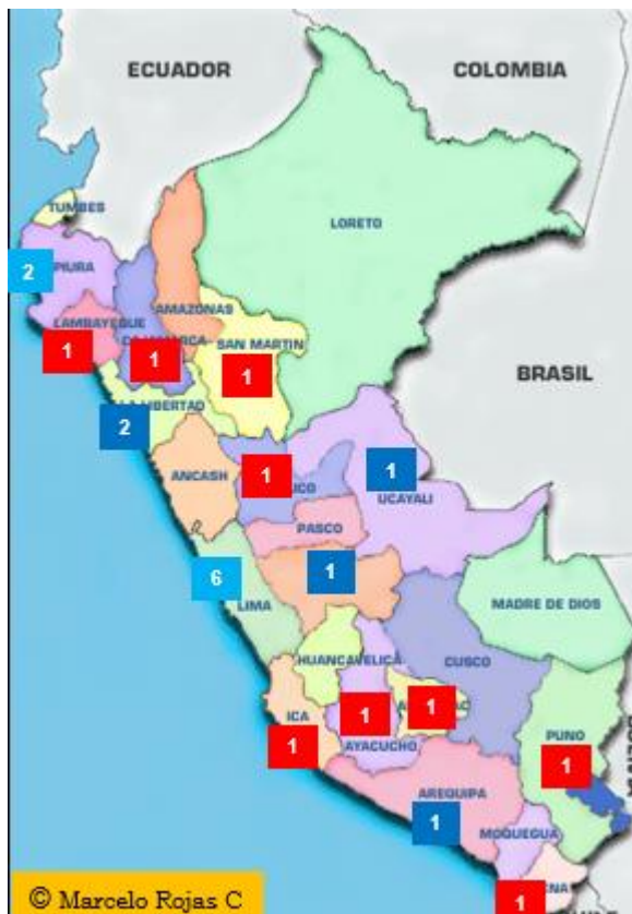
Fig 1. Distribución geográfica y Regional de las Facultades de Medicina Veterinaria o Medicina Veterinaria y Zootecnia

En la Fig 1, se muestra la distribución Regional (No Departamental) de las Facultades o Escuelas Académicas. La cantidad en fondo rojo, son públicas, en fondo azul, privadas, y en fondo azul claro: públicas y privadas [en Lima hay una publica y cinco privadas].