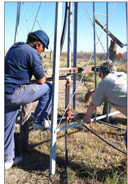
Sistema sostenible de extracción de agua

El proyecto tiene cuatro objetivos principales: