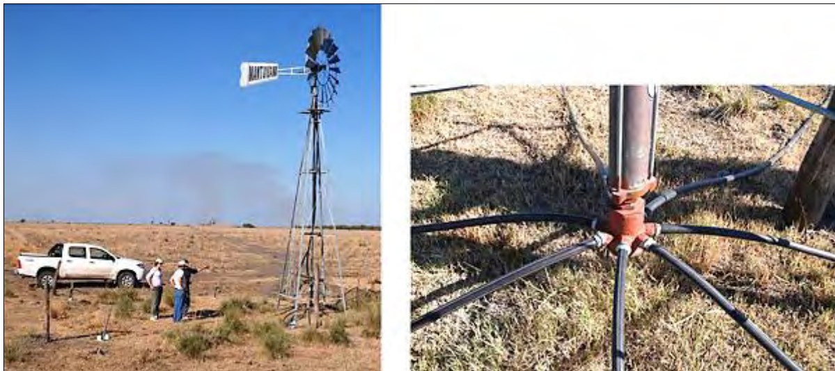
Pozo sistema araña

drangular (cuya estructura y profundidad se encuentran determinada por el estudio de geoelectrica para cada caso en particular), mediante la colocación de cañerías para la conducción del agua de entre 10 y 20 cm de diámetro. Al igual que las represas de almacenamiento, estos sistemas serán utilizados cuando los bordos no pueden abastecer la demanda de agua del ganado.