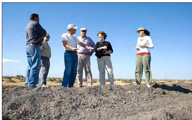
Visita técnica al proyecto

En este sentido, es importante destacar la participación y acompañamiento Institucional que ha tenido el proyecto en el desarrollo de estudios de base, en la búsqueda de alternativas que potencian la propuesta de manejo productivo encarada y en las tareas de difusión y extensión entre los beneficiarios. Entre los organismos que han acompañado al Proyecto pueden destacarse el Instituto Nacional de Tecnología Agropecuaria (INTA), la Administración de Parques Nacionales, el Programa de Producción Pecuaria Sustentable y Ordenamiento Ganadero y Apícola (PROGAN) y la ONG Aves Argentinas.