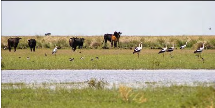
Ganadería y fauna en pastizales

Los humedales son extensiones de tierras con aguas permanentes o temporales. A diferencia de otros ecosistemas terrestres, el rasgo más particular de los humedales es que el agua determina sus funciones ecológicas. Muchos de ellos se caracterizan por presentar recurrentes ciclos de anegamiento y sequía, que determinan no sólo su dinámica ecológica sino también las condiciones de vida de sus habitantes. Los humedales proveen de numerosos bienes y prestan valiosos servicios como, por ejemplo, ser fuente fundamental de agua potable, ser reguladores del clima y permitir la retención de sedimentos y sustancias tóxicas. Por otra parte son albergue de una rica y variada flora y fauna.