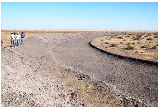
Bordo de retención

Represa de Recarga: Conociendo la ubicación y geometría de los bolsones de agua dulce se cavaron represas con el objetivo de acopiar agua de lluvia y contribuir a la recarga de los mismos. Esta práctica, ayuda a mantener el agua de lluvia por más tiempo y facilita la infiltración de la misma al acuífero.