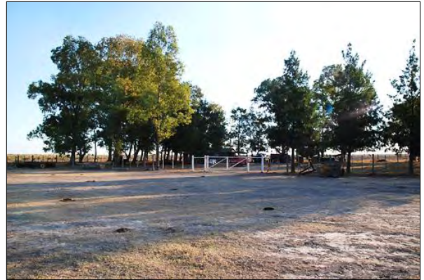
Finca en los Bajos Submeridionales

El intercambio de pareceres o formas de ver las cosas, cómo producir bien y conservar, que nos propone esta propuesta, creo que es lo correcto. Esto es algo que se debería tomar en toda la zona incorporando a todos los que estamos involucrados de alguna manera en la zona”.