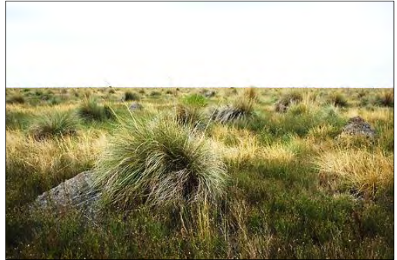
Espartillares de los Bajos Submeridionales

Más de tres cuartas partes de los Bajos Submeridionales se encuentran cubiertos por pastizales inundables, principalmente espartillares. En esta región habitan especies que se encuentran en peligro de extinción como el venado de las pampas, el aguará guazú y el águila coronada, y es el hábitat de cerca del 40% del ganado bovino de toda la provincia de Santa Fe.