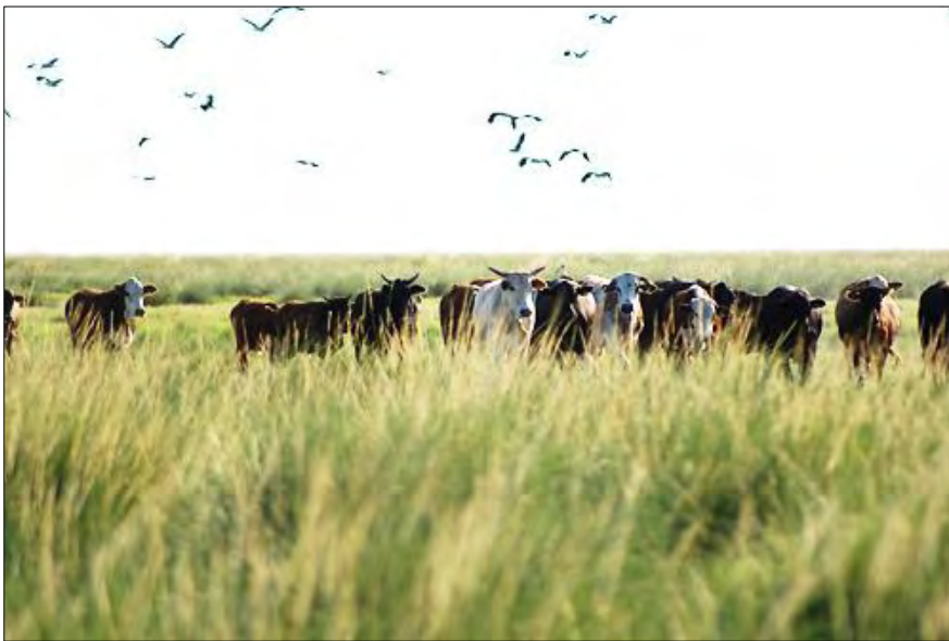
Ganadería y fauna en pastizales

Ante este contexto, el proyecto “Manejo ecológico – productivo del humedal de los Bajos Submeridionales, Santa Fe, Argentina” busca abordar los problemas identificados bajo el objetivo general de mejorar la calidad de vida de los pobladores de la zona, mediante la mejora de las prácticas productivas desarrolladas en el humedal, la recuperación de sus funciones agro-ecológicas y la preservación de los valores que éste tiene para la sociedad.