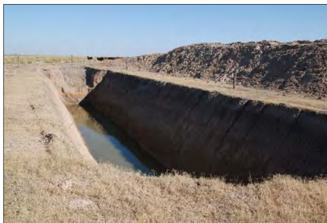
Represa de recarga

Pozos sistema araña: Por las características sedimentológicas de la zona sólo es posible obtener bajos caudales, por lo que se utilizó para la explotación un diseño de tipo araña con molino. Esta práctica consiste en la utilización de agua subterránea por medio de cuatro perforaciones a 6 metros de distancia entre si, en forma cua-