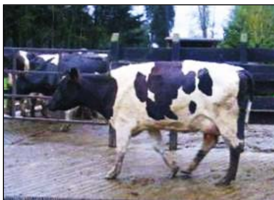
Figura 2. Vaca con problemas de patas.

Es importante tomar todas las medidas preventivas necesarias para que no se produzcan lesiones ni enfermedades, sobre todo en el parto y en el posparto temprano, momento en el que las vacas presentan las defensas más bajas. Las posibles enfermedades que se pueden dar son los problemas de patas, metritis, mastitis y alteración de la piel de las ubres (figura 2).