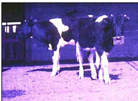
Vaquillona Holando Argentino con el vicio de mamar con una chapa en ollares, sostenida por un alambre que atraviesa el cartílago nasal, para impedirselo.