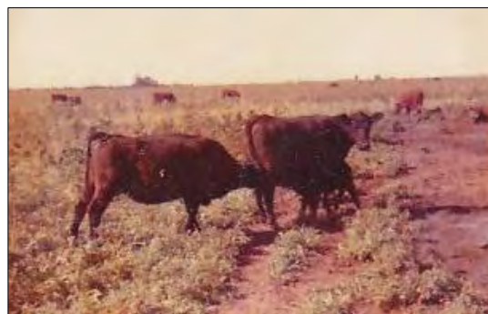
Vacas con cría mamando y otras vacas mamando de atrás