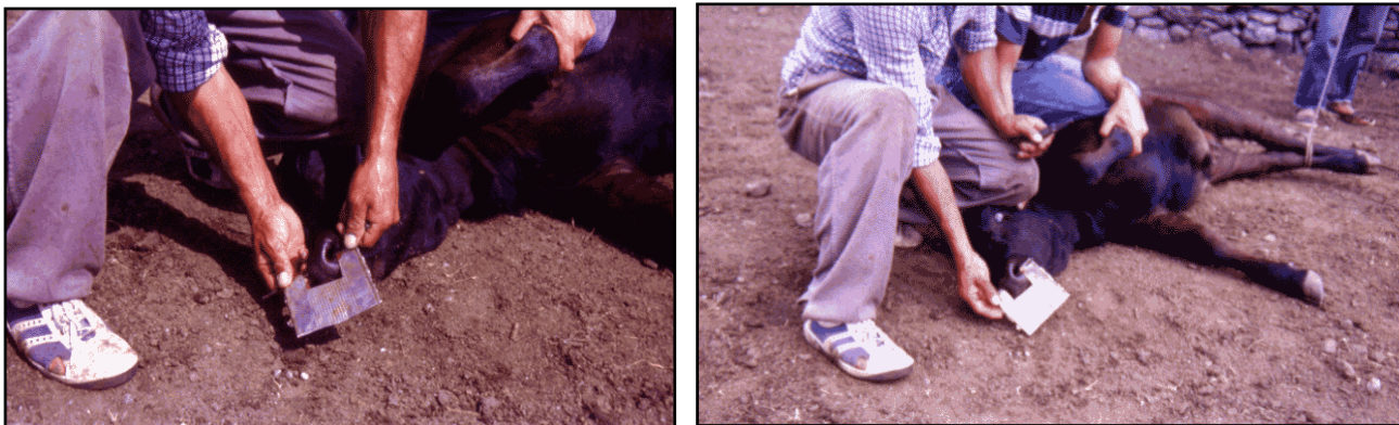
Colocación de la chapa en morro en un ternero.