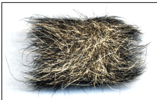
a) Ternero Holando Argentino chupando a otro en un corral; b) Masa de pelos ingeridos que causó la muerte de un ternero por obstrucción del píloro.