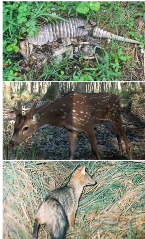
Fig. 2. Registros documentados de Dasyopus novemcinctus (arriba), Axis axis (centro) y Cerdocyon thous (abajo) para el Bajo Delta del Paraná, Buenos Aires, Argentina.

cionó la observación frecuente de zorros, usualmente “en pareja”, destacando que su aparición en el área habría ocurrido en 2005. Durante los relevamientos con trampas cámara se obtuvieron 69 fotografías de cánidos, todas atribuibles a esta especie (Fig. 2), en 8 de las 39 estaciones de muestreo ubicadas en 5 de los 7 establecimientos relevados (“Las Carabelas”, “Don Pedro”, “El Ñacurutú”, EDERRA y Woksekian). En base al patrón de coloración de los individuos fotografiados y a las fechas y sitios de obtención de esos registros, se confirmó la presencia en la muestra de al menos 16 individuos diferentes. Se conservó la piel de un ejemplar atropellado en cer-