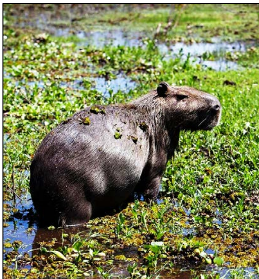
5. Carpincho: Puede llegar a medir hasta 1,30 metros y pesar unos 60 kilos. Su dieta se compone de pastos, gramíneas ribereñas y plantas acuáticas

Justamente los desarrollos inmobiliarios en la primera sección, hicieron necesario que en 2013 se sancionaran tres ordenanzas que hoy marcan el pulso del desarrollo de la zona: un plan de manejo que define lineamientos generales, una zonificación para las 22.000 hectáreas y un reglamento que determina las características de las edificaciones. A grandes rasgos, se prohibió el emplazamiento de nuevos barrios náuticos; casi un tercio de la superficie -la cara este- quedó tipificada como zona de protección; en los lotes aptos para edificar se redujo el porcentaje de ocupación total del suelo a la mitad y se estableció como obligatorio dejar intangible el fondo de la parcela, de forma tal que el corazón de las islas se preserve como bañado.