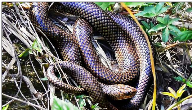
2. Culebra parda de agua: Llega a medir un metro de largo. Su coloración dorsal es castaña oscura y su vientre es amarillento con manchas negras.

Este relevamiento de aves, anfibios, peces, reptiles y mamíferos es el primero que se reduce a los 220 kilómetros cuadrados de islas que son jurisdicción del municipio de Tigre y conforman la primera sección del delta, que es el conjunto de islas que está frente a la costa de Tigre y San Fernando, desde el canal Arias y hasta el Río de la Plata, y entre el Luján y el Paraná. Hasta el reciente estudio, hecho por el Observatorio Ambiental del Delta, sólo se sabía que en todo el delta bonaerense, que abarca 2800 kilómetros cuadrados, la diversidad de especies era de 543. Por lo que ahora se pudo determinar que en la porción más densamente poblada, que representa menos del 10% de la zona, aún vive el 50% de las especies del área.