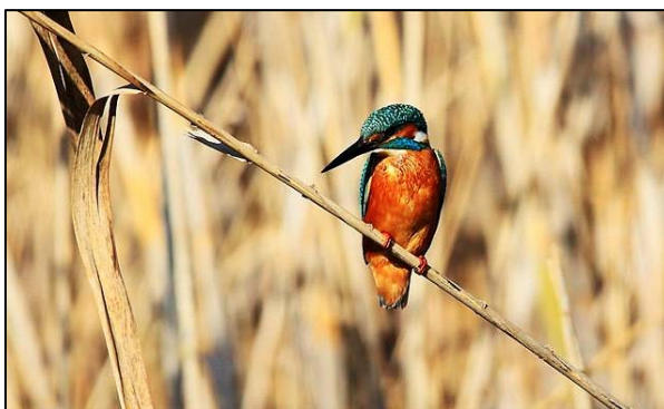
3. Martín Pescador: Mide entre 16 y 17 centímetros de longitud. Necesita taludes arenosos para excavar su nido. Se alimenta de peces, larvas y anfibios.

En el relevamiento que, fue hecho entre abril de 2015 y abril de este año, trabajaron cinco biólogos, un técnico en biodiversidad y un guardaparque. Se identificaron 114 aves, 95 peces, ocho anfibios, seis mamíferos y dos reptiles. De las primeras, sobresalen el carpintero, el martín pescador, la garza, el burrito dorado, la pava de monte y el federal. Entre los peces, se destaca el dientado jorobado, la mariposita, el cascarudo y el surubí pintado. También identificaron ejemplares de carpa, una variedad exótica que es parte de las 100 especies más invasoras del mundo.