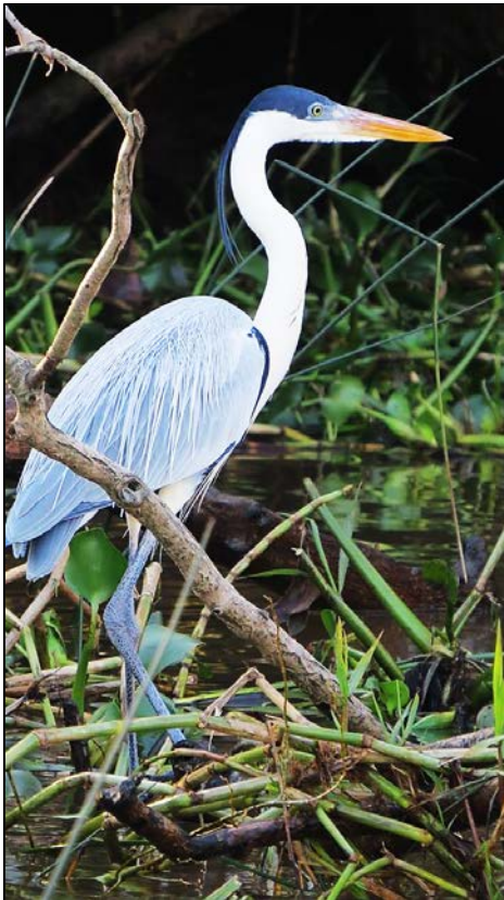
4. Garza Mora: Tiene una altura de 75 centímetros y se alimenta de peces, reptiles y anfibios. También se encuentra en los lagos de Neuquén y Chubut.

Justamente los desarrollos inmobiliarios en la primera sección, hicieron necesario que en 2013 se sancionaran tres ordenanzas que hoy marcan el pulso del desarrollo de la zona: un plan de manejo que define lineamientos generales, una zonificación para las 22.000 hectáreas y un reglamento que determina las características de las edificaciones. A grandes rasgos, se prohibió el emplazamiento de nuevos barrios náuticos; casi un tercio de la superficie -la cara este- quedó tipificada como zona de protección; en los lotes aptos para edificar se redujo el porcentaje de ocupación total del suelo a la mitad y se estableció como obligatorio dejar intangible el fondo de la parcela, de forma tal que el corazón de las islas se preserve como bañado.