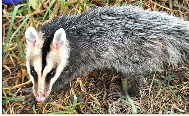
6. Comadreja: De hocico a cola, mide entre 60 y 90 centímetros. Es omnívora. Prefiere las zonas arboladas -cercanas a fuentes de agua- y los pajonales.