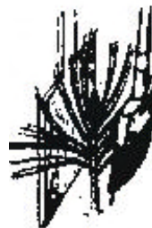
Aplicación con pincel