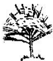
Protección con Lana