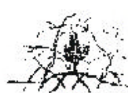
Protección con Ramas