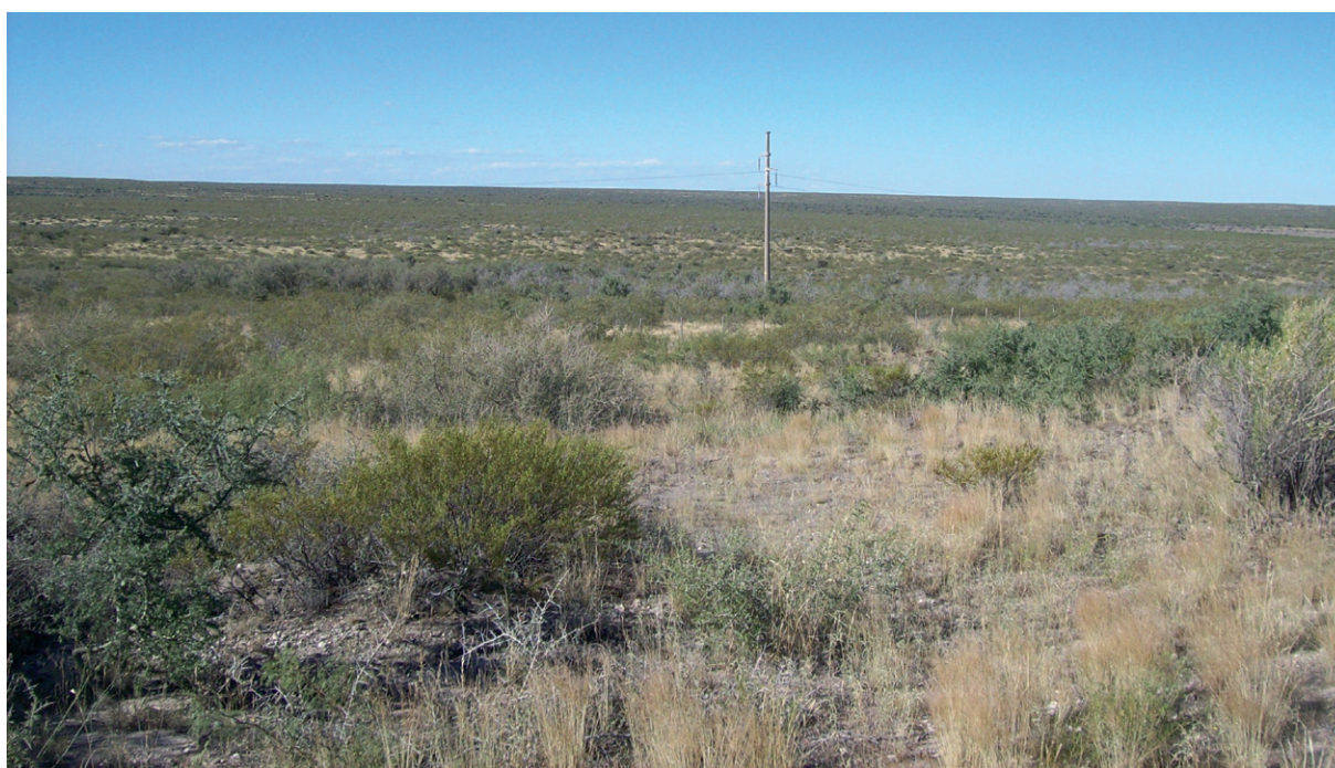
Foto 1. Características del hábitat de una pareja nidificante de Falco femoralis en el noreste patagónico.

En el presente trabajo se proporciona un registro de una pareja nidificando en un poste de electricidad, un sitio de nidificación aún no descrito para la subespecie F. femoralis femoralis (ni pichincha ) de este halcón.