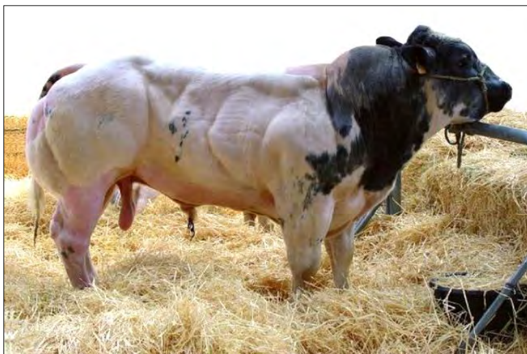
En bovinos de las razas Charolais, Piamontesa y Belgian Blue, es conocida la doble musculatura de los músculos traseros.

Estos genes se consideran improntados porque una copia del gen (alelo) está epigenéticamente marcada o improntada en el ovocito o en el espermatozoide. Por ello, la expresión alélica del gen improntado va a depender si proviene del padre o de la madre de la generación previa. Luego, ya en el embrión, su comportamiento va a depender del estado de desarrollo, del tejido en el que tenga que expresarse, es decir, del ambiente intra o extracelular al que se encuentre integrado. Los genes improntados que intervienen en redes de eventos epigenéticos pueden causar diferentes patologías, ya que presentan una función haploide. Los cambios epigenómicos que alteran sus funciones pueden provocar desastres potenciales en los efectos de la salud. Se manifiestan con frecuencia en el desarrollo temprano, como desórdenes neurológicos, y como cáncer cuando aparece tarde en la vida.