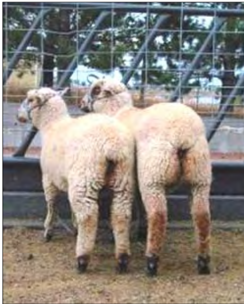
Mutación Callipyge (CLPG1), que provoca hipertrofia muscular en los músculos traseros en varias razas ovinas.

otros genotipos: +M/+P; CLPGM/CLPGP; CLPGM/+P expresan fenotipo normal. Hoy se sabe que esta mutación se encuentra en la región de una serie de genes improntados que se expresan por vía paterna (DLK1 y PEG11), exhibiendo una sobre-expresión en estos, mientras que minimiza la expresión de genes maternos (GTL2; antiPEG11; MLG8).