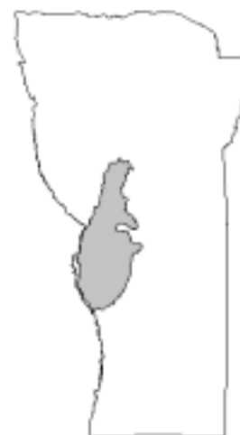
Fig. 1: Área de estudio

La cartografía de las áreas quemadas se realizó interpretando visualmente las imágenes "quick look" de los satélites Landsat 5 TM y 7 ETM de la página Web de CONAE (Conae, 2003). Se examinaron 87 escenas del período 26-03-1997 a 19-03-2003 y se digitalizaron los incendios. Los ocurridos entre octubre y marzo se denominaron estivales y los de abril a septiembre invernales, alcanzando un total de 13 fechas (7 estivales y 6