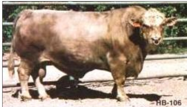
Toros de D. C. Basolo: a) Nacido el 08.01.75. A los 205 días pesó 295 kg, a los 365 días 572 kg y a los 2 años 912 kg; b) Nacido el 14.06.74. A los 205 días pesó 304 kg, a los 365 días 483 kg y a los 2 años 923 kg.