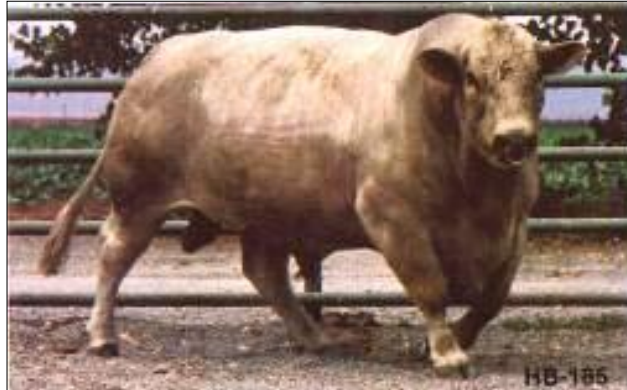
Toro de D. C. Basolo nacido el 05.01.76. A los 205 días pesó 279 kg, a los 365 días 550 kg y a los 2 años 952 kg.

En cruzamientos absorbentes con Beefalo sobre cualquier otra raza bovina o índica, las Asociaciones consideran raza pura en las hembras al 7/8 Beefalo (F 3 ) y en los machos al 15/16 Beefalo (F 4 ).