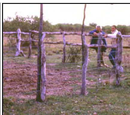
a)-Escamoteador construido con alambrado; un caño horizontal impide la entrada de las vacas pero permite la de los terneros; dentro el comedero, construido con un cajón de sembradora en desuso. b)-Escamoteador construido con alambrado, mostrando la amplia entrada para los terneros (todo un lado del corral), protegida de las vacas con troncos de eucaliptos colocados horizontalmente

Para que las vacas se acerquen al escamoteador, y por ende los terneros, se puede desparramar algo de ración alrededor del mismo. Las vacas permanecerán cerca un tiempo, oliendo y tratando de comer esa ración, y los terneros irán entrando solos al escamoteador. Con el mismo fin, también es conveniente colocar el saladero cerca del escamoteador, y si se considera necesario, se pueden colocar rollos cercanos al escamoteador para estimular la concentración de la hacienda en el lugar.