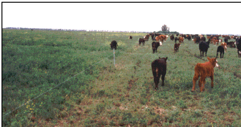
A la derecha, las vacas con sus crías en una parcela en su cuarto día de comida; el alambre eléctrico, alto, permite el paso voluntario de los terneros a la parcela siguiente (a la izquierda), a la que despuntan.

Comparando la suplementación al pie de la madre con el pastoreo diferencial, este último sistema reduce los costos y los requerimientos de mano de obra.