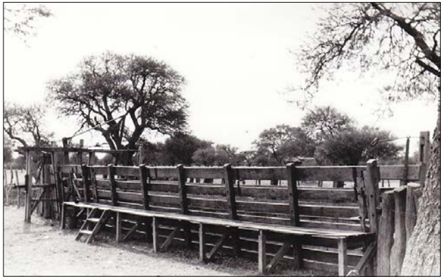
a) y b) Caldén y sombra de toro con vista externa de un corral palo a pique; c) Vista interna del corral palo a pique, con un calden al medio que se usa como palenque; d) Bretes colocados a continuación del corral palo a pique. Establecimiento “26 de Abril”, oeste de Ingeniero Luiggi, La Pampa, zona del caldenal. Fotos tomadas por alumnos de la Cátedra de Zootecnia Especial I (Bovinotecnia) de la Facultad de Ingeniería Agronómica de la Universidad del Centro (Río Cuarto) durante un práctico realizado durante varios días en la provincia de La Pampa en 1970.