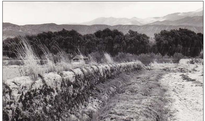
División de potreros con pared de adobe. Uquía, Jujuy.