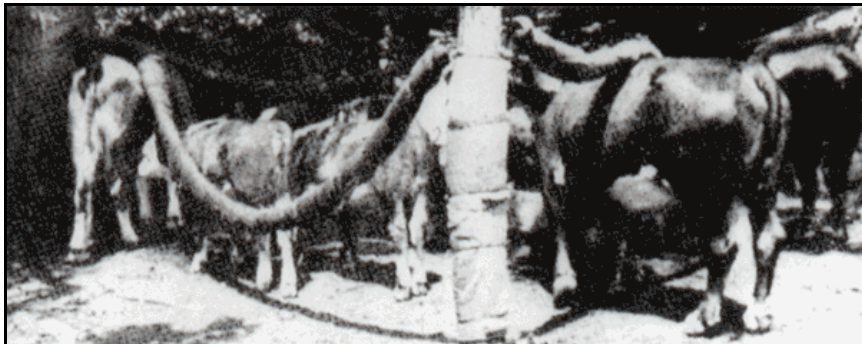
Rascador de tres sogas con suministro de suplemento mineral al centro.