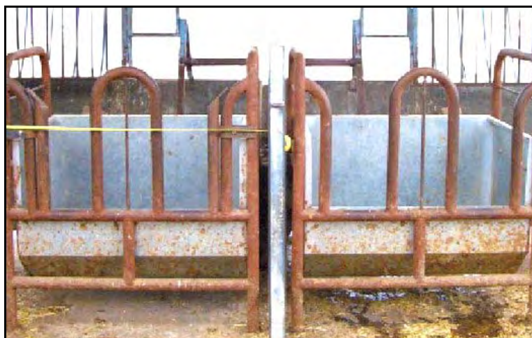
Comedero diseñado para el experimento para que sólo un animal pudiera introducir la cabeza en el momento de comer pienso.

Los AGNE en cambio no se vieron afectados por la competencia durante el resto del engorde, mientras que los BHBT aumentaron linealmente. Posiblemente ello esté relacionado con un aumento en la concentración ruminal de butirato (González y col., 2008b). Los niveles de haptoglobina en sangre aumentaron linealmente al aumentar la presión social por el pienso tanto durante la adaptación como en el resto del cebo (tabla 3).