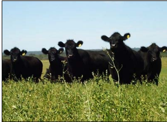
Nuevos logros en la investigación genética para raza Angus

La Evaluación Genómica impulsada por el INTA y la Asociación Argentina de Angus permitirá una mayor precisión en la evaluación de reproductores jóvenes al aplicar nuevas técnicas basadas en el genotipado del ADN, la molécula esencial de la herencia.