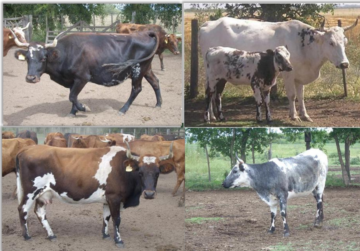
Figura 3. Vacas criollas con distintos pelajes típicos de la raza ( Creole cows with different pelage typical of the breed )

raza criolla, se produce como consecuencia de apareamientos continuos entre parientes (endocría) y que debido a la alta consanguinidad existente se produce cierta “degeneración” o aparición de pelajes raros y variados. Como se ha demostrado científicamente, el mayor número de colores, su diferente distribución y la combinación de los mismos para formar la capa de los bovinos, manifiesta la presencia en esa población de mayor cantidad de variantes genéticas de color para la expresión del pelaje que en una raza uniforme. No se trata de ningún defecto o degeneración biológica, por el contrario, puede ser ventajoso para los animales a la hora de responder a determinadas condiciones climáticas como por ejemplo a la radiación solar. La variabilidad de pelajes puede observarse en poblaciones de bovinos de la raza criolla ya que la misma no ha sido seleccionada por ningún pelaje en particular y constituye una característica típica de la raza (Figura 3).