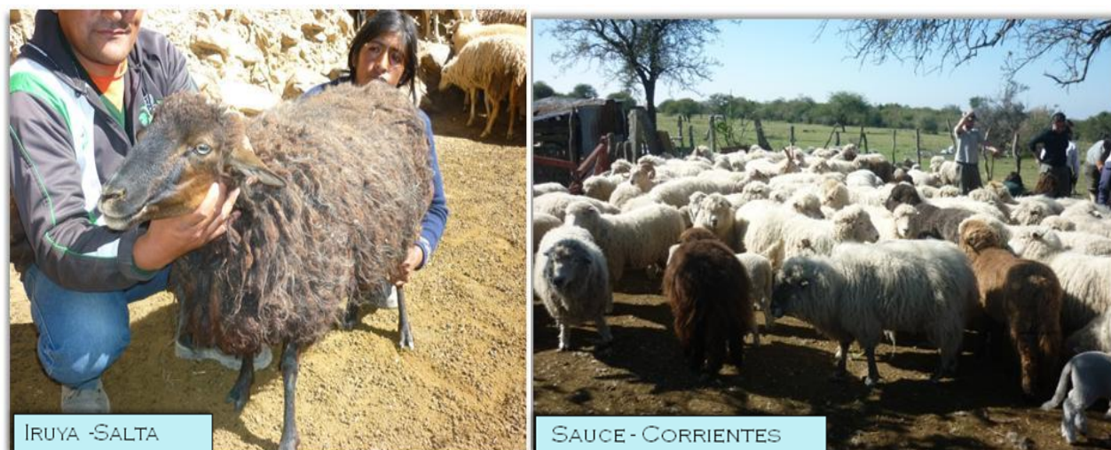
Figura 5. Ovejas criollas adultas de dos regiones distintas ( Creole adult sheeps in two different regions )