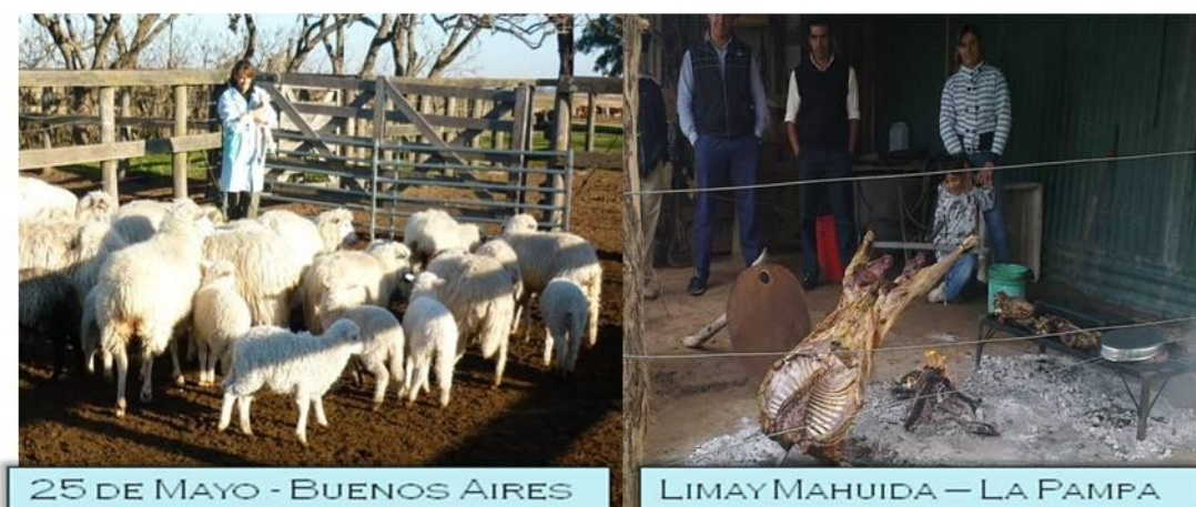
Figura 6. A: Ovejas y corderos criollos en Buenos Aires B: Borrego criollo al asador La Pampa ( A: Sheeps and lambs creoles in Buenos Aires. B: lamb creole spit in La Pampa )