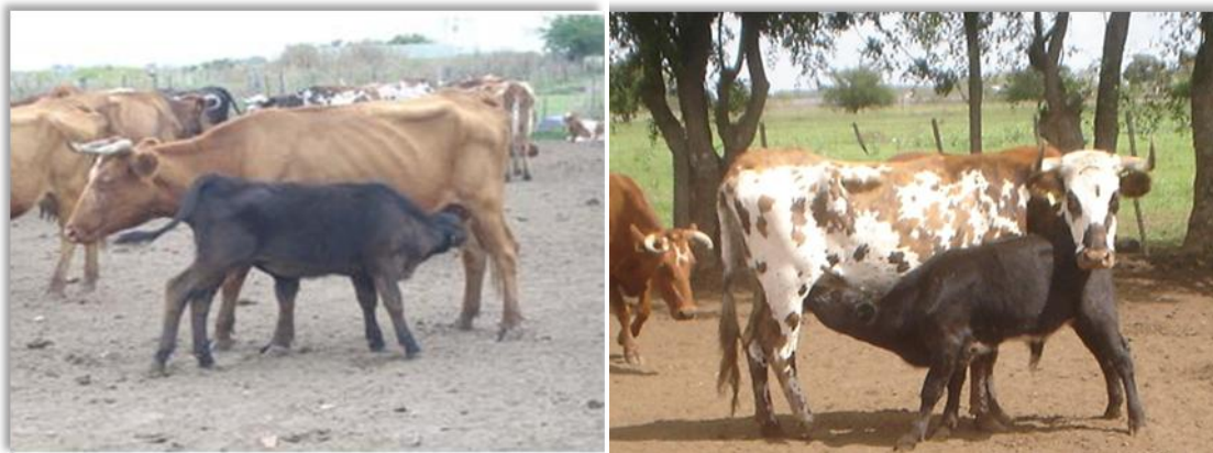
Figura 4. Vacas criollas con sus hijos de padre Aberdeen Angus Negro ( Creole cows with his calves of parents Black Aberdeen Angus )

tiene una consecuencia comercial importante que hace que los animales con pelajes uniformes reciban un mejor precio que aquellos con pelajes variados, aunque la calidad y cantidad del producto sea la misma. El prejuicio 3, podría disolverse considerando seriamente que: El estándar de la raza bovina criolla admite la presencia de todos los colores de pelaje, lo cual se traduce en una alta variabilidad fenotípica y genética.