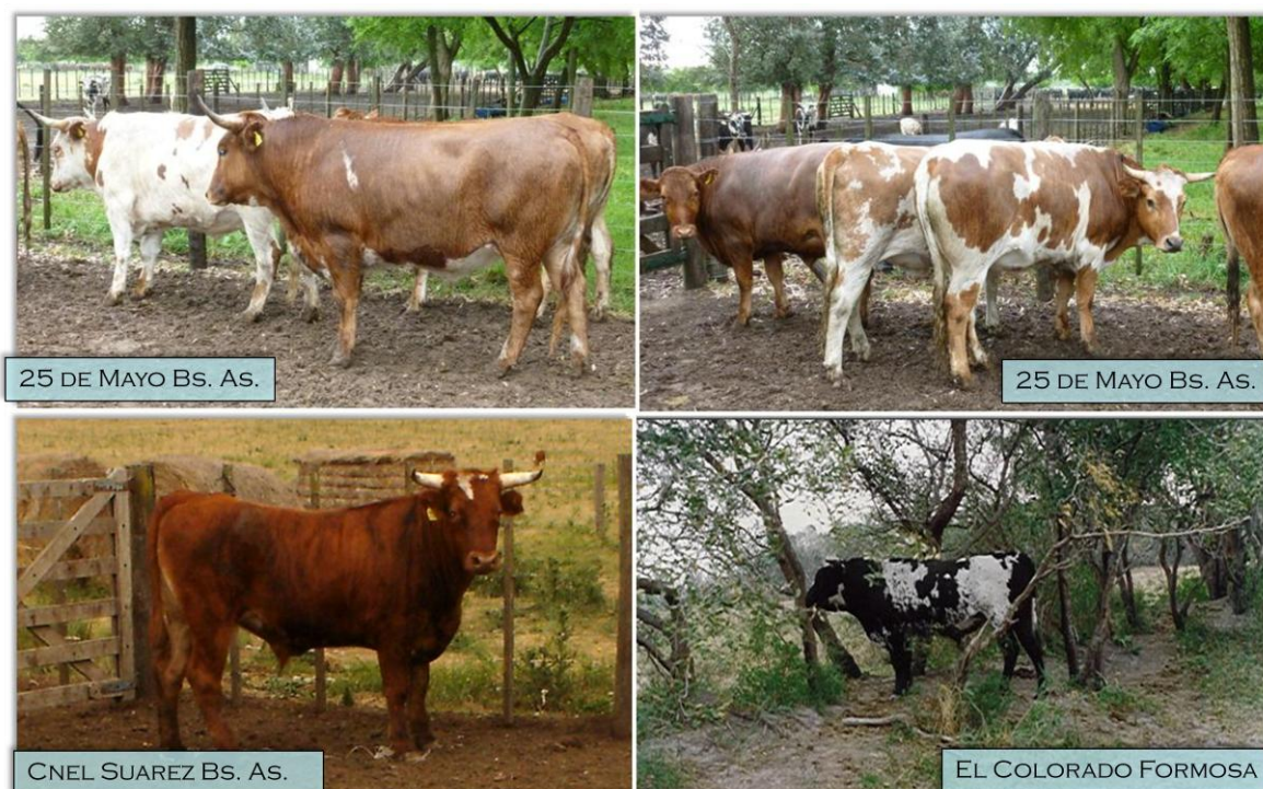
Figura 2. Novillos Criollos producidos en distintos ambientes de Argentina ( Creole steers produced in different environments of Argentina )