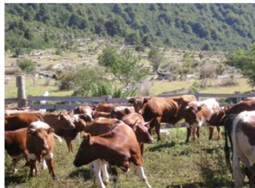
Figura 1. Machos y hembras de BCP. Figure 1. Male and female individuals of BCP.