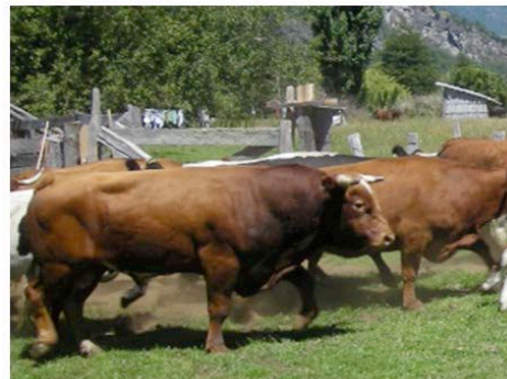
Figura 3. Machos BCP presentes en el predio. Figure 3. Males BCP at the farm.