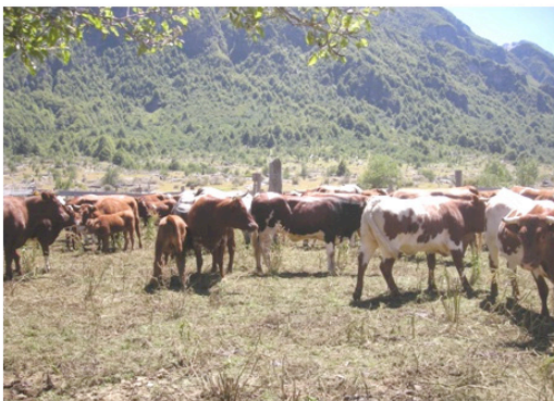
Figura 2. BCP, donde se aprecia que en su mayoría poseen el color café. Figure 2. BCP, mostly brown colored.