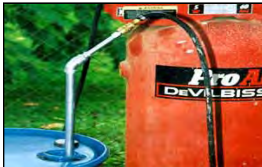
Fotografía 2.- En el extremo superior se coloca un codo y 10 cm de nicle roscado en hierro galvanizado de ½ pulgadas, en cuyo extremo superior se fija un aditamento que permite una conexión firme que impide que se escape el aire comprimido, al conectar el bastón con la manguera de un compresor de aire.

presión, por los agujeros del bastón perforado, revolviendo fuertemente hasta disolver y mezclar todos los componentes del suplemento (Fotografía 2).