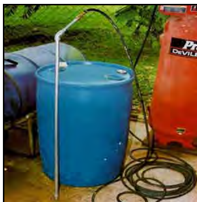
Fotografía 1.- La distribución uniforme del suplemento se facilita con el uso del bastón construido con el tubo de 1.2 m.

En el extremo superior se le coloca un codo y luego 10 cm. de niple roscado en hierro galvanizado, a cuyo extremo superior se fija un aditamento que permite una conexión firme y que evita el escape del aire comprimido, al conectar el bastón con la manguera de un compresor de aire (Fotografía 1).